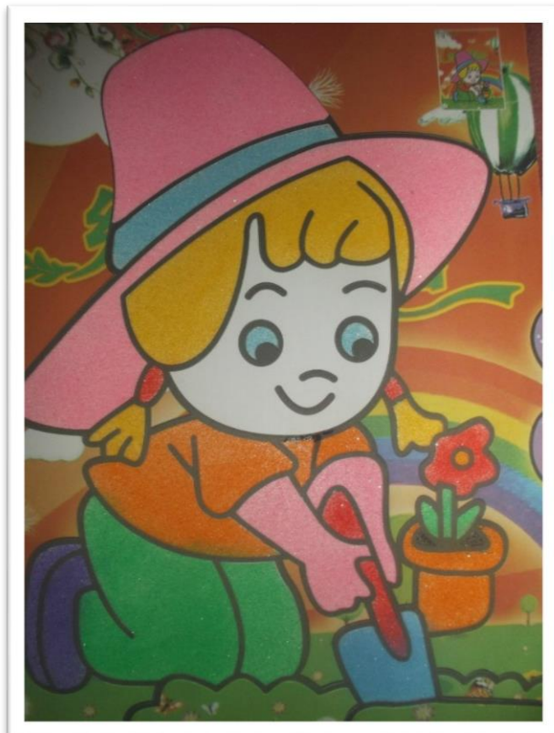
Рисование цветным песком