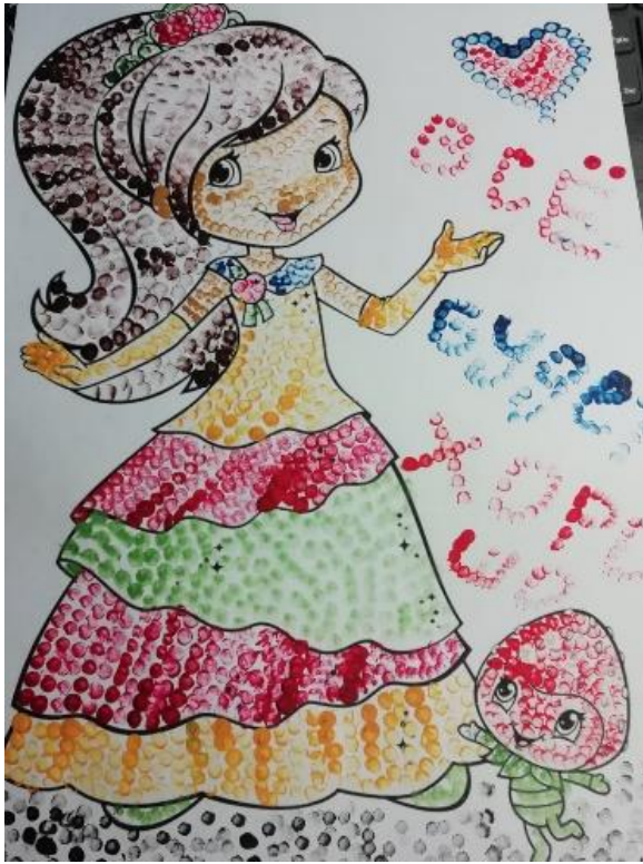
Рисование ватными палочками