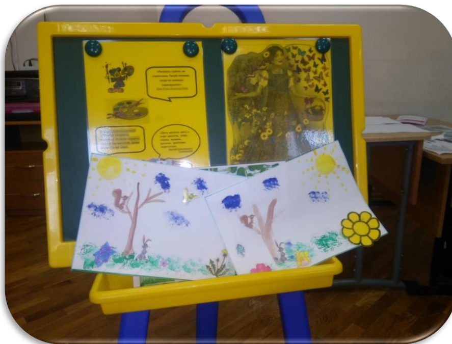
Рисование ватными палочками, салфеткой

Нетрадиционное рисование – интересное и увлекательное рисование, которое привлекает своей простотой и доступностью, раскрывает возможность использования казалось бы ненужных предметов в качестве художественных материалов; играет важную роль в эстетическом развитии ребенка. Нетрадиционные методы рисования благодаря своей легкости и простоте помогают раскрыть у детей логическое мышление, фантазию, наблюдательность, внимание, трудолюбие, любовь к прекрасному.